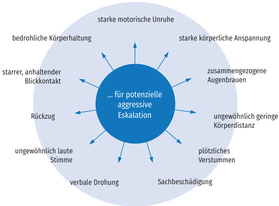
Abbildung 12: Frühwarnzeichen

signale aufgelistet, die nach Meinung und Erfahrung des Autors am häufigsten auftreten: